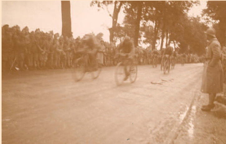
Premier Tour de France organisé après la Grande Guerre. 1919.